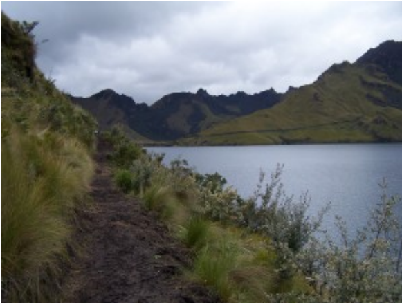
Laguna de Mojanda, rodeada de extensos pajonales y remanentes de bosque nativo.

En el Ecuador, el Páramo es uno de sus diversos ecosistemas, probablemente el más frágil e importante, cuya extensión no es posible establecerla con exactitud por la cada vez más frecuente exposición a las actividades humanas entre ellas el avance de la frontera agrícola, las quemas y el cambio de uso del suelo como zona de pastoreo. Los planes de manejo participativo de los páramos tienen como fin recuperar, restaurar o conservar estos importantes espacios que almacenan el agua que sirve para la provisión del líquido vital a las comunidades ubicadas en cotas más bajas.