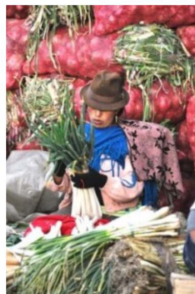
FAO en Ecuador,

Este problema se genera por las migraciones de jóvenes de las comunidades rurales a las ciudades ya sea por falta de trabajo o por educación. Ello a su vez incrementa considerablemente la forma de alimentarse de las culturas, recogiendo todo ese bagaje disperso pero rico en conocimiento que tienen en cada zona del país, Ésta búsqueda se denominó “recogiendo el pasado y juntando con el presente para construir el futuro”.