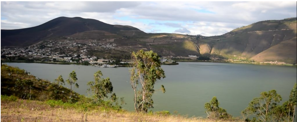
Lago Yahuarcocha o comunmente llamado Lago de Sangre.