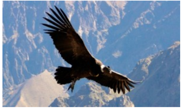
Vultur gryphus

La Guía para el Establecimiento y Manejo de Áreas de Alimentación Suplementaria (AAS) para Cóndor Andino en el Ecuador (Sección 3.3)”; señala que: el AAS debe estar colocado en una plataforma elevada, con la finalidad de evitar problemas con especies domésticas, principalmente los perros, no debe estar en lugares con actividad humana cercana, ni especies en cautiverio, tampoco puede contar con cámara trampa para el monitoreo. En caso de estar involucrada una comunidad, ésta debe comprometerse con el correcto manejo del AAS, para lo cual se estableció la firma de un convenio.