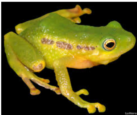
Pristimantis carlosceroni.

Se describe una especie nueva de Pristimantis verde de la ladera occidental de los Andes de Ecuador en el Distrito Metropolitano de Quito (DMQ). La especie nueva se distingue por su coloración dorsal verde e iris con tres anillos de colores en vida, piel del dorso y flancos areolados, y por carecer de procesos odontóforos vomerinos.