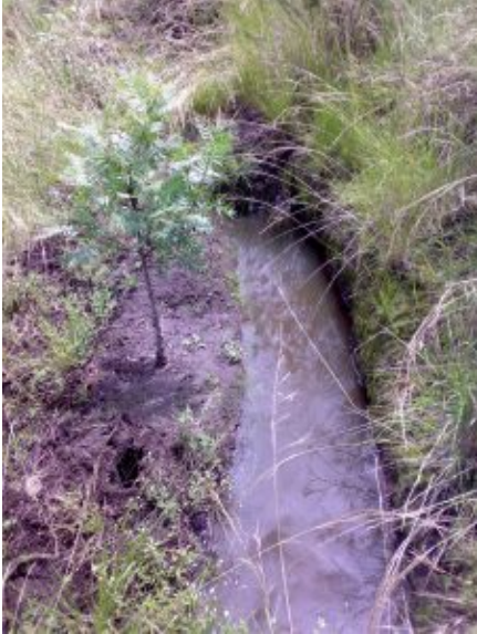
Retención de agua en las zanjias de infiltración, Yahuarcocha

El área de la microcuenca del lago Yahuarcocha, siempre ha captado el interés de Instituciones públicas y Organismos de Desarrollo. No obstante, los esfuerzos por mejorar la cobertura vegetal en la zona, aún siguen siendo insuficientes o se pierden a causa del mal manejo, el pastoreo o las quemas.