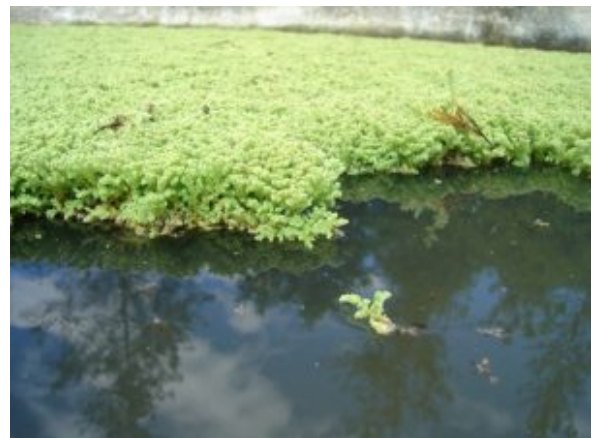
Azolla filiculoides.

Los sistemas de depuración de bajo coste energético pueden ser una alternativa de tratamiento de las aguas residuales domésticas en entornos rurales al basarse en reproducir, en