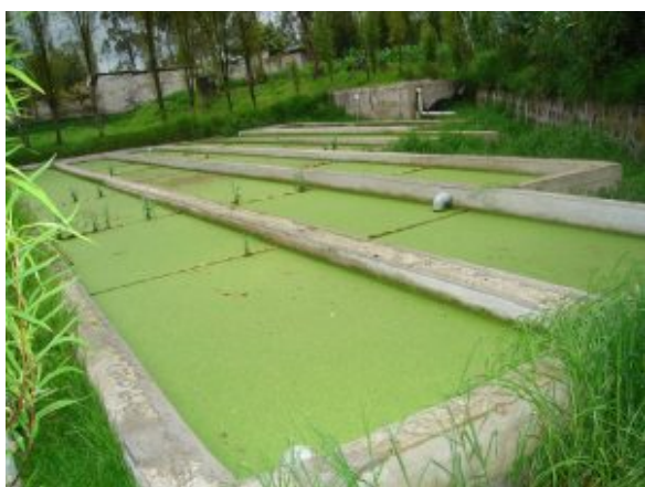
Lemna gibba

raíces son variables en longitud de unos 10 cm a 90 cm de largo. Es una planta de rápido crecimiento distribuida en casi todos los países tropicales, que puede tolerar condiciones de contaminación por metales o por eutrofización de cuerpos de aguas lénticos y lóticos. Esta planta se ha convertido en un problema ambiental; no obstante, ha despertado interés en el tratamiento de la contaminación por metales en suelos agrarios y cuerpos de agua (Benítez et al., 2011).