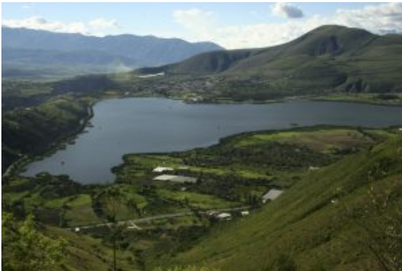
Vista de Yahuarcocha

La microcuenca posee un desnivel que se extiende desde los 2200 msnm, altura en la que se encuentra el espejo de agua de Yahuarcocha, hasta los 3720 msnm., la superficie del área es de 866.53 ha.