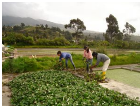
Cosecha del jacinto acuático

Lemna gibba L. o lentejas de agua son pequeñas macrófitas flotantes que prosperan en aguas estancadas o de corriente lenta. Las lemnáceas constituyen una familia de plantas vasculares, que flotan libremente sobre la superficie del agua, y que tienen una distribución mundial. Existen cuatro géneros: Spirodela, Lemna, Wolffia y Wolffiella, y cerca de 40 especies (Cordoba et al., 2010).