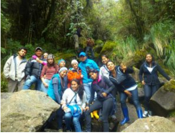
Estudiantes de la Carrera durante una salida de campo

La carrera de Ingeniería en Recursos Naturales Renovables fue creada mediante Resolución del Honorable Consejo Universitario, el 28 de Octubre de 1996. Nació para atender el requerimiento de profesionales que a través de sus conocimientos contribuyan a la solución de problemas relacionados con la degradación de los recursos naturales, en áreas socialmente deprimidas en la Región Norte del Ecuador.