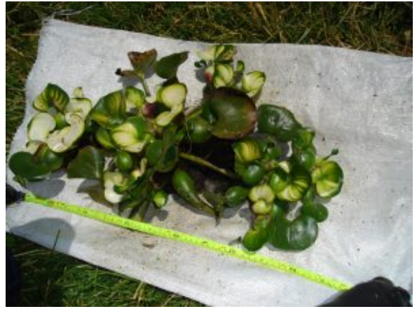
Eichhornia crassipes . – lechuguín