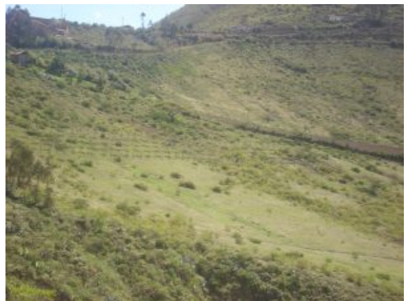
Ensayo instalado en el entorno del Lago Yahuarcocha

Las zanjas de infiltración acortan la longitud de la pendiente, disminuyendo de esta manera los riesgos de grandes escorrentías que causan erosión en sitios de ladera durante la