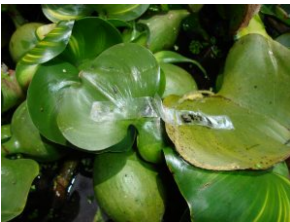
Eichhornia crassipes.

Eichhornia crassipes, Lemna gibba y Azolla filiculoides, aplicadas en asociación o monocultivos en sistemas comunitarios y unifamiliares, en el proceso de remoción de contaminantes en aguas residuales domésticas.