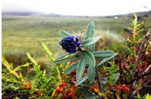
Vegetación alto andina

estructural que dan lugar a formaciones lineales de interés hídrico. Además se pudo observar la cobertura vegetal original que va desde las plantas parcialmente sumergidas hasta las formaciones arbóreas y arbustivas del bosque en galería. Se evidenció que los pocos parches remanentes de vegetación riparia actualmente están siendo destruidos mediante la quema de los mismos.