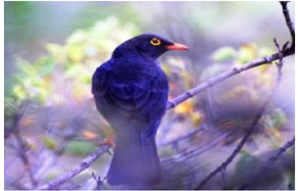
Mirlo de los Páramos Andinos

Fue posible establecer estrategias de conservación en la zona media-alta de la microcuenca de Yahuarcocha en tres niveles: a nivel de paisaje fue posible definir las zonas de intervención de las estrategias, a nivel de ecosistemas se definió la fisionomía y estructura de los hábitats actuales, y finalmente al nivel de poblaciones definir las especies nativas y endémicas de la zona, que constituyen especies de interés para la conservación.