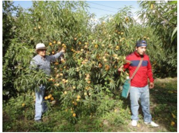
Cultivo ensayo de durazno en la provincia de Imbabura.

Estas circunstancias, junto con estructuras de propiedad muy diseminada, reducida superficie de las explotaciones y estrechos marcos de plantación obligan a realizar un análisis específico de este sistema. Para ello se desarrollaron modelos matemáticos para cuantificar la cantidad de material lignocelulósico e inventariar de forma rápida la cantidad de biomasa contenida en una parcela a partir de la medición de parámetros tales como: el diámetro de copa, diámetro del tallo y altura de la planta.