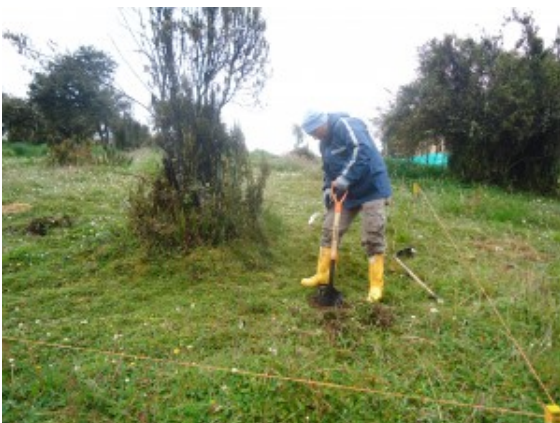
Establecimiento del área de

están conformados por árboles + pasto mejorado, árboles + pasto natural y pasto mejorado, respectivamente. Estos tratamientos permitieron determinar la relación entre las especies forestales nativas de altura, y su sostenibilidad a través del análisis de variables climáticas, como una medida de adaptación al cambio climático. Se observaron diferencias significativas entre los promedios de peso y altura del pasto, las que indica que: el T1 presenta mayor incremento en altura y el T3 presenta mayores incrementos en peso. Entre los promedios de materia orgánica, nitrógeno y hierro en el suelo, T3 presentó un incremento significativo, para el Zinc T2, para el potasio T3, en magnesio para T2 y en cuanto al número de lombrices en T2, seguido por T1. Los datos de la estación hidrometeorológica, que monitoreó el comportamiento microclimático durante un año, puso en evidencia que los componentes del sistema silvopastoril modifican el microclima del entorno, aumentando la resiliencia del ganado, lo cual contribuye al bienestar del animal; y, además disminuye el impacto de la ganadería en los ecosistemas en donde se desarrolla. También es indiscutible el potencial de los sistemas silvopastoriles para generar efectos positivos sobre el ambiente y por lo tanto ofrecer servicios ambientales. Un manejo adecuado de estos recursos representan una medida de adaptación al cambio climático y una excelente opción en futuros arreglos agroforestales.